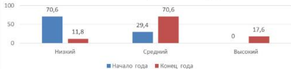
Показатели развития познавательных процессов на начало и конец учебного года (%)

В ХОДЕ ОБСЛЕДОВАНИЯ ИСПОЛЬЗОВАЛИСЬ МЕТОДИКИ: