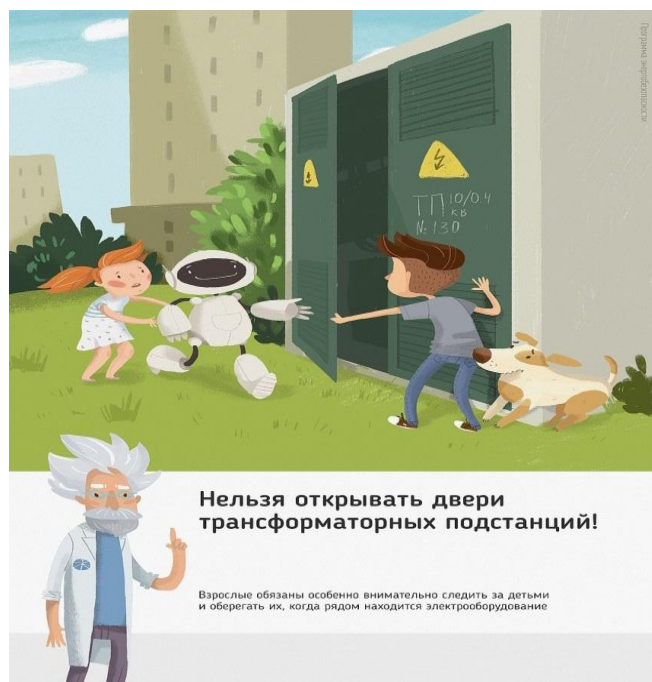
Рис.1. Нельзя открывать двери трансформаторных подстанций

Ежегодно энергетики проводят для школьников познавательные уроки, конкурсы рисунков и историй на тему электричества и правильного с ним обращения. Но работы одних энергетиков в данном направлении недостаточно, для полного понимания проблем электробезопасности нужен пример общества, в котором растет ребенок, и, конечно же, главным образом родителей. Эта работа приносит свои результаты: электротравмы на энергетических объектах единичные, и каждый случай становится поводом для служебной проверки. Но только технических мер мало для того, чтобы полностью обезопасить детей. Им нужен пример родителей.