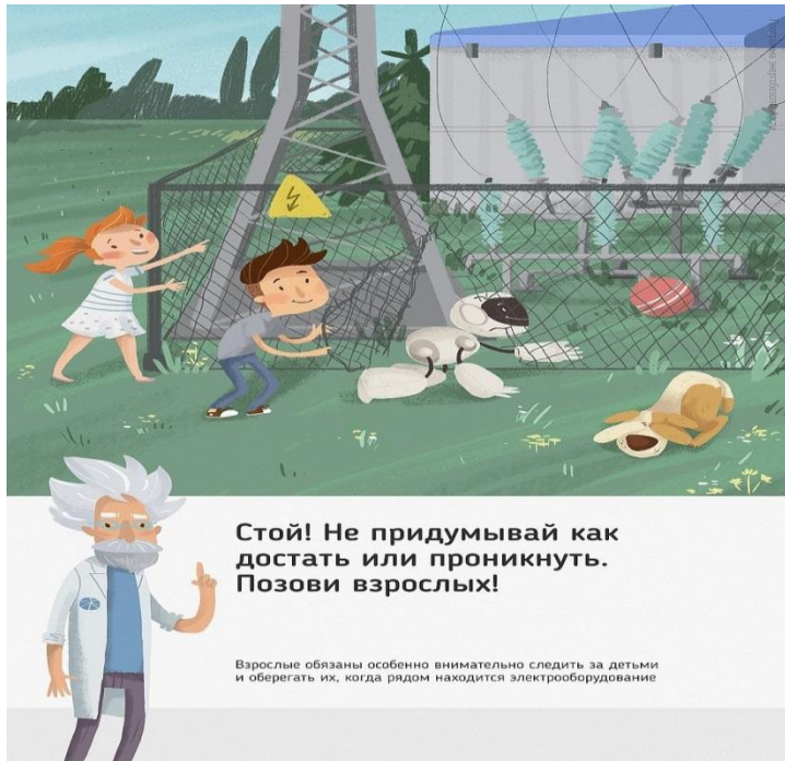
Рис. 5. Стой! Не придумывай, как достать или проникнуть. Позови взрослых!