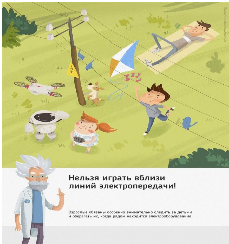
Рис.3. Нельзя играть вблизи линий электропередачи