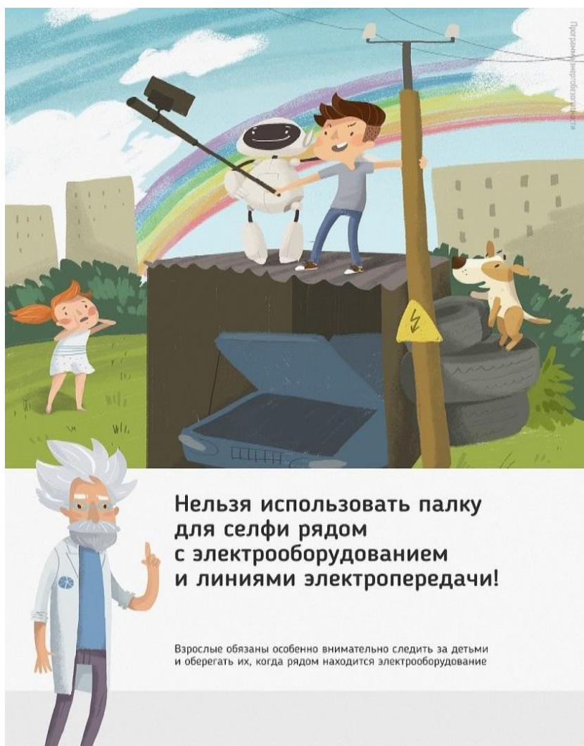
Рис 2. Нельзя использовать палку для селфи рядом с электрооборудованием и линиями электропередачи

Ну и, наконец, нужно повторить с ребенком алгоритм действий в экстремальной ситуации. Проверьте, умеет ли он набирать на сотовом телефоне телефон экстренных служб. Изучите с ним вещества и предметы, которые хорошо проводят электрический ток и потому особенно опасны, и, наоборот, вещества и предметы, плохо проводящие электрический ток и полезные в экстремальной ситуации.